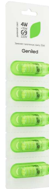
Рисунок 2 – Внешний вид упаковки.

Примечание: не пригодна для использования совместно со стандартными регуляторами уровня яркости.